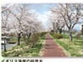
イギリス海軍の桜木 イギリス海軍から岩手大森方面へ続く、約2kmに達する樹齢300年の桜木。毎年、素晴らしい桜を咲かせてくれます。