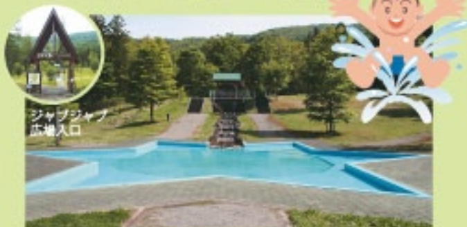
真湯の郷・ジャブジャブ広場

お子様連れのご家族が楽しめる「真湯の郷・ジャブジャブ広場」、「フィールドアスレチック施設」があります。また、「森林散策歩道」や「テニスコート」がありますので、ご家族で、お気軽にアウトドアライフをお楽しみいただけます。