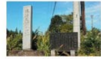
橋場の石標。この石標は、明治時代に設置された。この石標は、橋場の歴史を伝える重要な証拠である。