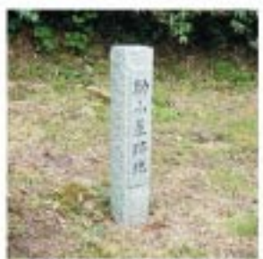
仙岩峠の石標。この石標は、明治時代に設置された。この石標は、仙岩峠の歴史を伝える重要な証拠である。